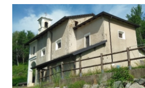
Chiesa “Beata al Monte” 616 m

Il tracciato della gara si sviluppa attorno al lago di Sant’Agostino (o “Lago dei rospi”), lungo un itinerario panoramico che tocca alcuni tra i punti più caratteristici dal punto di vista storico e naturalistico di questa zona della Valsesia tra i comuni di Varallo, Quarona e Cellio con Breia (in provincia di Vercelli).