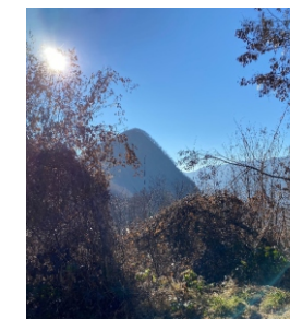
Monte Tucri - 798 m