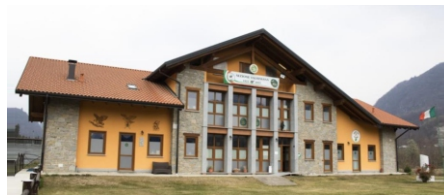
Sede della "Valsesiana" - 408 m