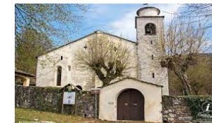
Chiesa di San Giovanni (monumento nazionale) - 550 m